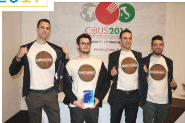
La squadra CHOCOSHELL, vincitrice dell'edizione 2016

A tal fine, raccomandiamo vivamente di fare riferimento alle norme UNI ISO 14040 (2006) relativa al Life Cycle Assessment (LCA), e UNI ISO 14064 PARTE PRIMA relativa al calcolo del carbon footprint (CF).